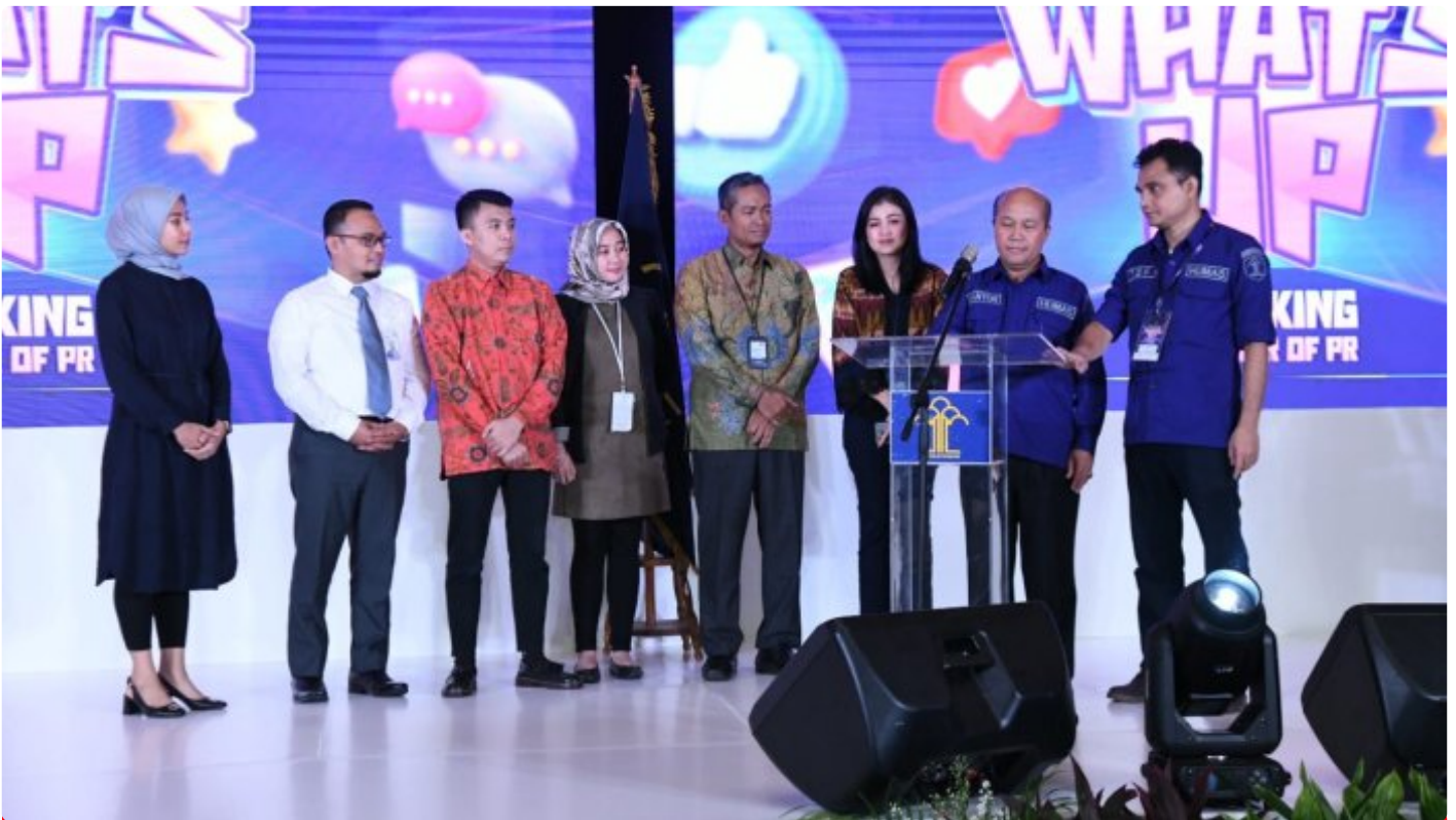
Humas Kemenkumham RI adakan Acara Bertajuk What's Up

JAKARTA - Kementerian Hukum dan Hak Asasi Manusia (Kemenkumham) menyelenggarakan kegiatan bertajuk "What's Up". Acara ini digelar sebagai upaya peningkatan kapasitas dan kompetensi insan humasnya.